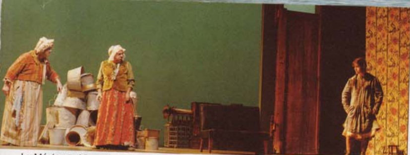
La Méchante Vie, adaptation de Henry Monnier par Jérôme Deschamps et Macha Makeïef