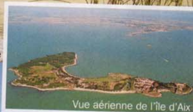
Vue aérienne de l'île d'Aix

Tout près de Royan, un univers sauvage accessible à tous les amoureux de la nature