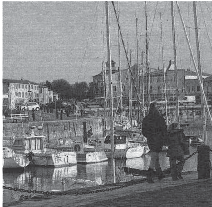
Le port de Saint-Martin-de-Ré est très jet-set l'été.

Mais l'île de Ré véritable s'apprécie hors saison. Pas avant que la masse de touristes de la période estivale ne soit rentrée chez elle. A partir d'octobre, les artistes, poètes et autres amoureux de la mer retrouvent leur île qu'ils partagent en har-